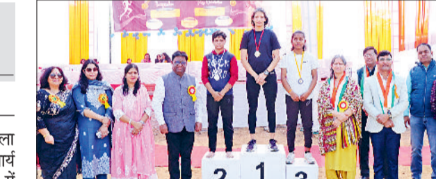
मिवानी। प्रतिभागियों को सम्मानित करते हुए अतिथि।