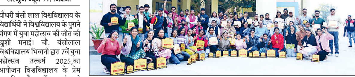
युवा उत्सव में रनरअप की ट्राफी जीतने के बाद प्रतिभागियों का किया सम्मान।

चौधरी बंसी लाल विश्वविद्यालय के विद्यार्थियों ने विश्वविद्यालय के पुराने प्रांगण में युवा महोत्सव की जीत की खुशी मनाई। चौ. बंसीलाल विश्वविद्यालय भिवानी द्वारा 7वें युवा महोत्सव उत्कर्ष 2025 का आयोजन विश्वविद्यालय के प्रेम नगर स्थित कैम्पस में 21 नवंबर से 23 नवंबर तक किया गया था। इसमें यूटीडी भिवानी के युवा कलाकारों ने बेहतरीन प्रदर्शन की बदैलात रनर ट्राफी पर अपना कब्जा बसाया था। कलाकारों ने 5 विधाओं में प्रथम, 11 में द्वितीय व 6 में तृतीय स्थान प्राप्त करते हुए 22 विधाओं में