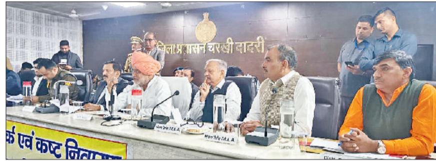
चरखी दादरी। जिला कष्ट निवारण समिति की बैठक में समस्या सुनते कृषि मंत्री।

बौराव को लघु सचिवालय सभागार में आयोजित जिला लोक संपर्क एवं कष्ट निवारण समिति की बैठक में कृषि मंत्री के समक्ष विभिन्न विभागों से संबंधित कुल