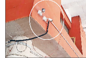
भिवानी। बस अड्डे पर लगे सीसीटीवी कैमरे व परिसर में कैमरे लगाते हुए।

अब बस अड्डे पर हर व्यक्ति की गतिविधियों पर नजर रहेगी। चाहे दिन हो या रात, बारिश हो धुंध। हर मौसम में 24 घंटे बस अड्डे पर आने वाले हर वाहन या हर व्यक्ति की गतिविधियां नए आधुनिक सीसीटीवी कैमरों में दर्ज होती रहेंगी। हालांकि अभी इस नई व्यवस्था को चालू होने में दो से तीन दिनों का और वक्त लग सकता है, लेकिन उसके बाद हर गतिविधियों का ब्योरा जीएम व टीम के कार्यालय में रखे कम्प्यूटर में दर्ज होता रहेगा। जब भी अफसर चाहेंगे, उसी दिन की सीसीटीवी फुटेज को खंगाल सकेंगे। फिलहाल