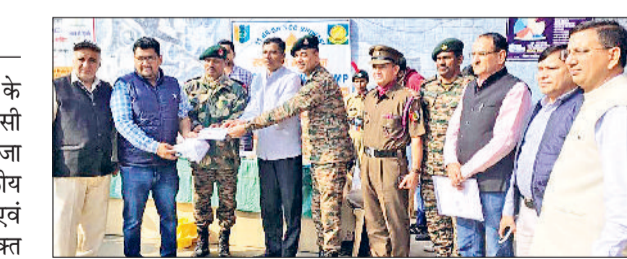
मिवानी। रक्तदाताओं को सम्मानित करते हुए।