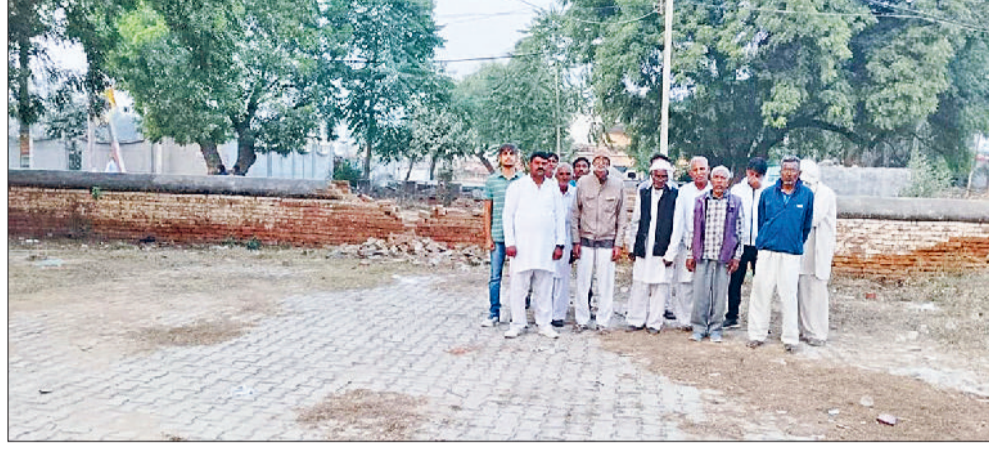
धर्मशाला की चारदीवारी न बनने का विरोध जताते हुए।

कस्बे के लोगों ने अपना सहयोग दिया था। पिछले करीब दो साल से धर्मशाला की चारदीवारी पुरानी होने के कारण कई जगहों से गिर गई है। इसको लेकर वे सरपंच से मिले और निर्माण किए जाने की मांग की, लेकिन चारदीवारी की हालत दिन प्रतिदिन क्षतिग्रस्त होती गई। ग्राम पंचायत ने चारदीवारी तो बनाई नहीं लेकिन समाचार पत्रों में ग्राम पंचायत के विज्ञापन में उसे बनाई दिखाई है जिससे समाज के लोगों में भारी रोष है। लोगों ने कहा कि जब उन्होंने सरपंच से बात की तो सरपंच ने कहा कि वे चारदीवारी बनाने पर उस पर अपना बोर्ड लगाएंगे। जबकि समाज के लोग इस पक्ष में नहीं हैं। क्योंकि धर्मशाला का निर्माण ग्राम पंचायत ने नहीं करवाया है वरन पूरे बहल गांव के लोगों से सहयोग लिया गया है। ऐसे में वे ग्राम पंचायत का नाम कैसे अंकित करवा सकते हैं।