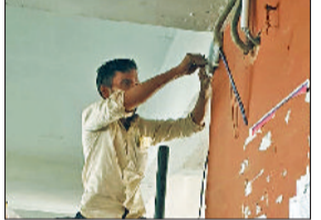
भिवानी। बस अड्डे पर लगे सीसीटीवी कैमरे व परिसर में कैमरे लगाते हुए।

उल्लेखनीय है कि रोजवेज बस अड्डे पर कुछ जगहों पर सीसीटीवी कैमरे लागे थे। उनमें से कुछ खराब