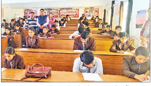
लोहारू के टुकराल स्कूल में भारत को जानो में हिस्सा लेते हुए विद्यार्थी।